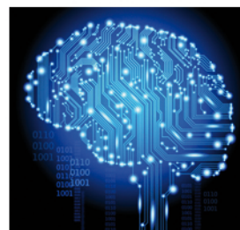
DISTRIBUTED, EMERGENT CULTURAL COGNITION